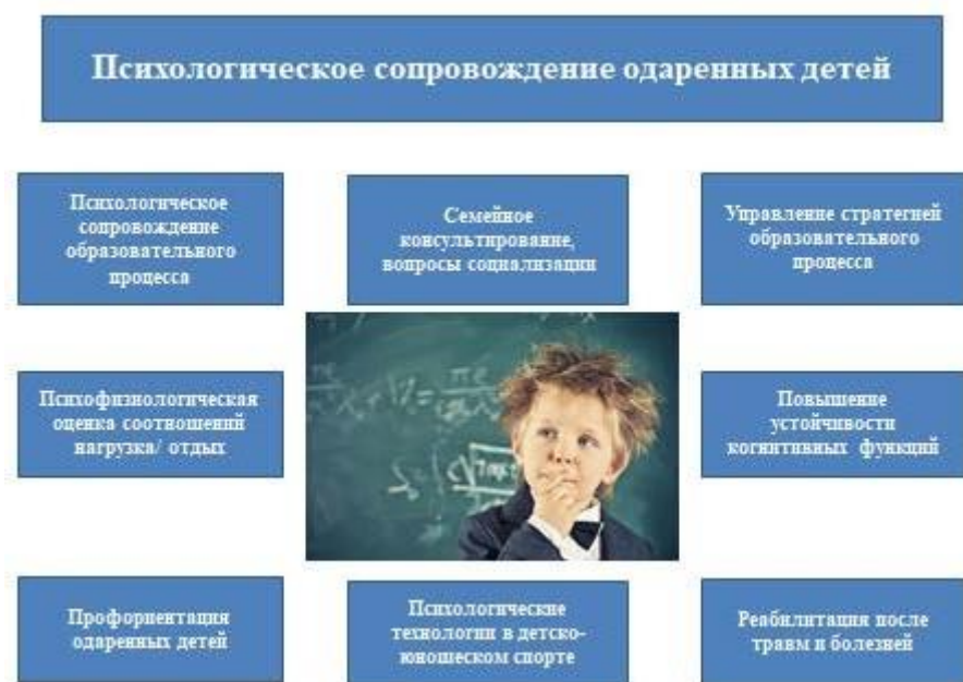
Рис. 2. Психологическое сопровождение одаренных детей

образовательных организациях (Концепция развития психологической службы в системе образования в Российской Федерации на период до 2025 года утверждена министром образования и науки РФ О. Ю. Васильевой 19 декабря 2017 г.), основные направления которого представлены на рис. 2.